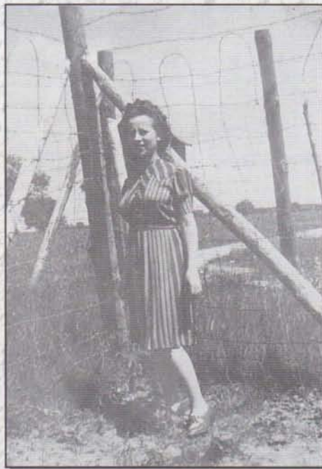
Document H. Steinling