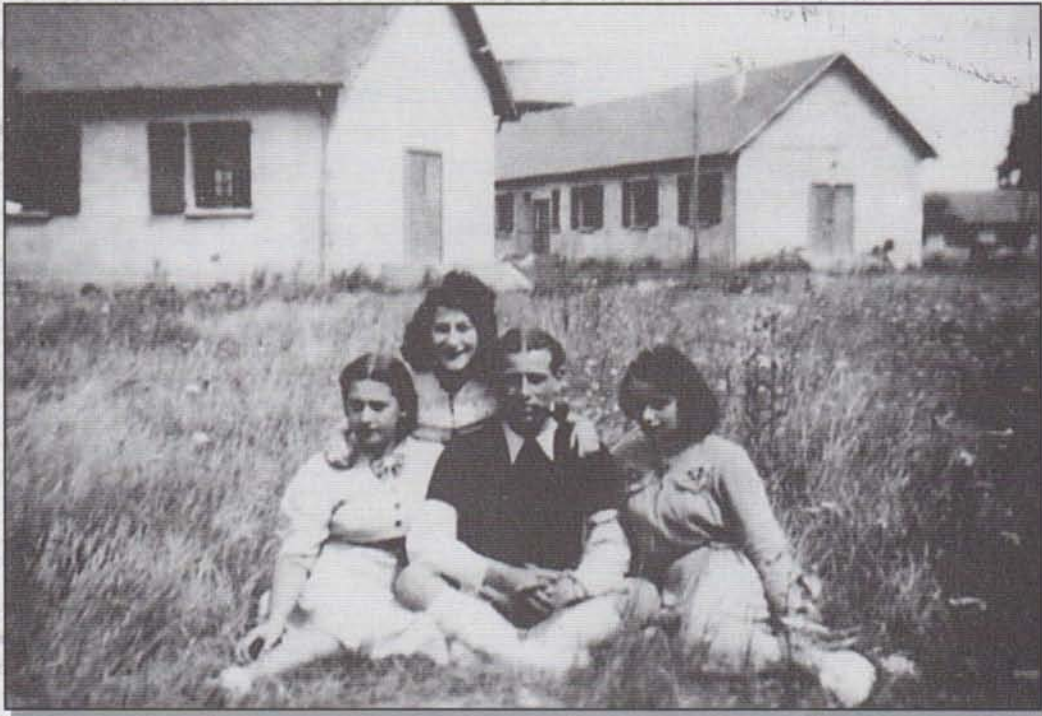
Document J. Scorin